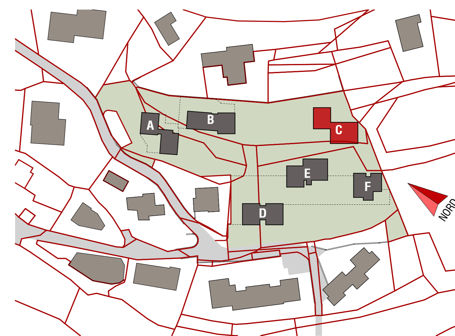
INQUADRAMENTO FABBRICATI 1 : 1000